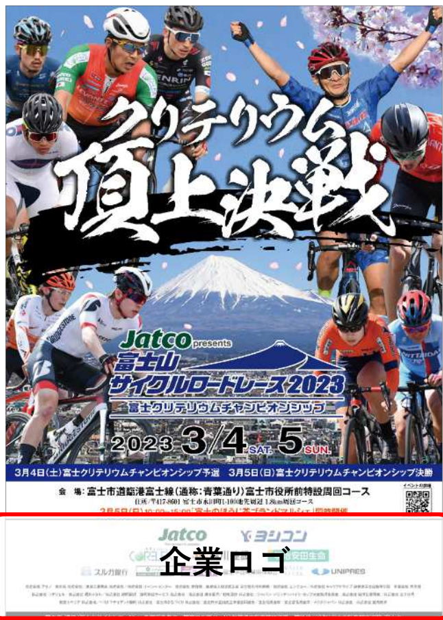
※イメージは過去大会のものです

大会ポスター及びチラシへ企業ロゴ等を掲載します。ポスターとチラシは市内各所に配架・掲示し、チラシは市内の全戸（約9万2千戸）へ配布します。