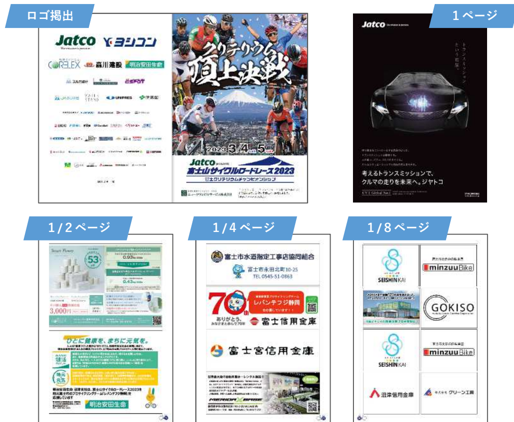
※写真は過去大会のものです